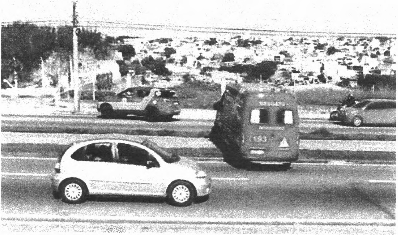
Imagem de travessia do canteiro central